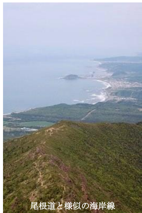
尾根道と様似の海岸線

12時過ぎに駐車場に無事到着。 今日は天気が良かったし、気温も高かったので、 大汗をかいて、着物がびっしょりだ。 着物をまるごと替えて、トイレの流しで水洗い。 車に吊るして乾かした。 腹が減ったので、カップ麺の昼食を食べ 14時 まで木陰でゆっくり休み、昨夜に続いて今夜も泊る 「道の駅・三石」へ向かった。