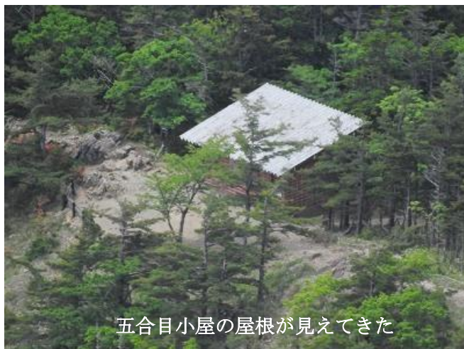
五合目小屋の屋根が見えてきた

下りの道で、眼下に見下ろす尾根道と、その向こうに広がる太平洋と様似の美しい海岸線が目を癒し、 下る足を軽くしてくれた。