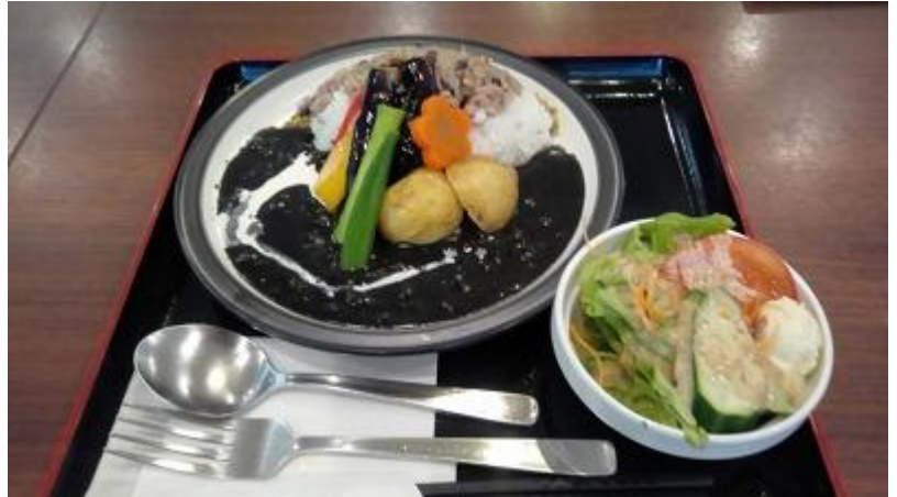
道の駅「北竜」レストランの黒いカレー

北竜の沼田ICから再び高速に乗り直し、ひたすら走って札幌に着いた。ここで一旦高速を下りてガソリンを給油してから、また高速に乗って恵庭まで、やっと道の駅「花ロード恵庭」に着いた。ここまで 370 km、頭がボーとしてきた。この駅は私の大好きな駅で、毎年必ず泊まっている。今日もここで車中泊ときめこんだ。ここは風呂が隣接していないのが欠点、少し離れた所にある「日帰り温泉ラフォレ」まで行かなければならない。今日は疲れて動く気も起きないので、ビールを 2 缶開けて夕食を済ませそのまま熟睡した。