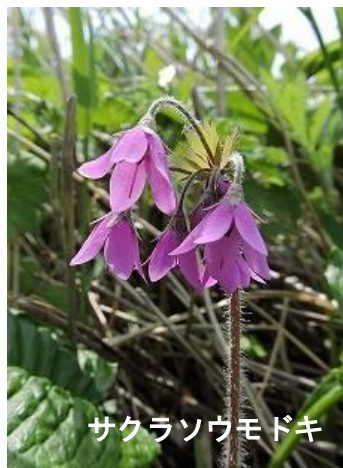
サクラソウモドキ