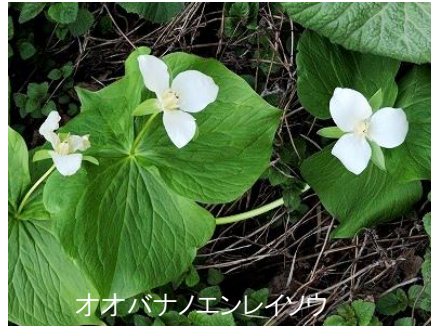
オオバナノエンレイソウ