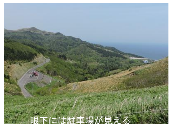
眼下には駐車場が見える