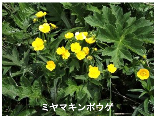
ミヤマキンポウゲ

ミヤマキンポウゲの黄色の花が所々で見られクロユリもちらほら咲いている。なにしろ人がいないのが良い。私一人、ほかに誰も歩いていない。