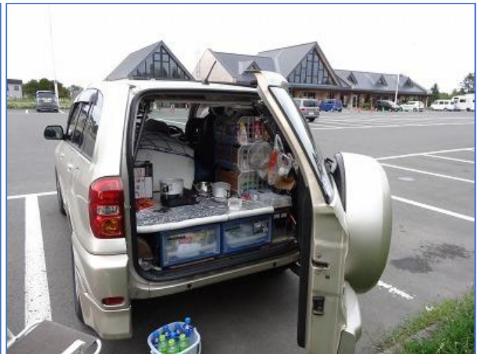
今日は道の駅「花ロード恵庭」で車中泊